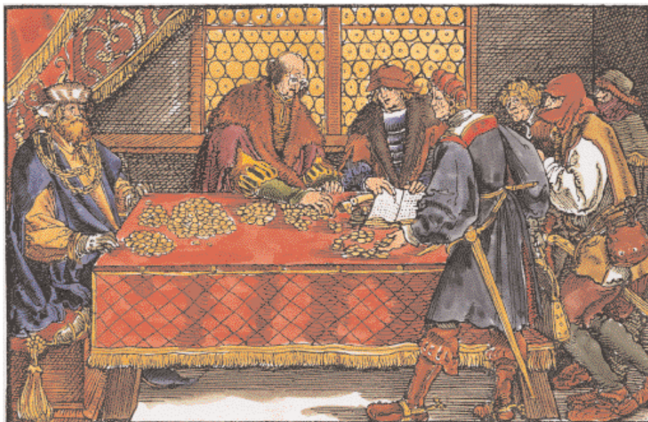
Odevzdávání desátku v peněžní podobě. Často se daň platila v naturáliích, kterými bylo obilí nebo dobytek.

koho ze svých blízkých vybavit na křížovou výpravu do Svaté země. Ovšem ne každý křížák byl odhodlán svůj dluh splatit. Rytíři byli zvyklí okrádat nepřátele, které porazili v boji. A bájná bohatství Východu pro ně byla nesmírným lákadlem.