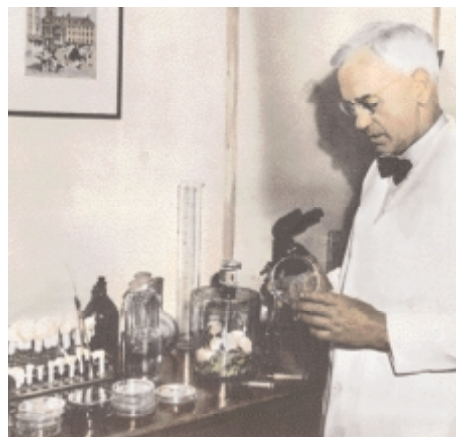
Alexander Fleming, objevitel penicilinu

Velká většina mikroskopicky malých hub nepředstavuje pro člověka žádné riziko, některé z nich jsou dokonce užitečné. Vyskytují se však druhy, které jsou škodlivé či nebezpečné.