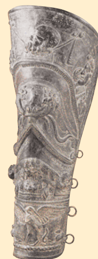
Pár vysokých, bohatě zdobených chráničů nohou pro thraex nebo hoplomacha, kolem roku 70 n. l. Hmotnost 2,3 a 2,5 kg.