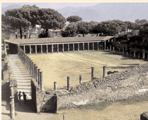
Kasárna gladiátorů v Pompejích