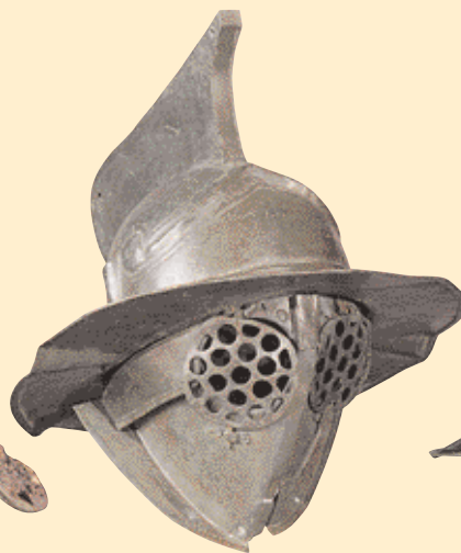
Přilba murmilla s krepou a malými kulatými průhledy, kolem roku 40 n. l. Hmotnost 3,4 kg.