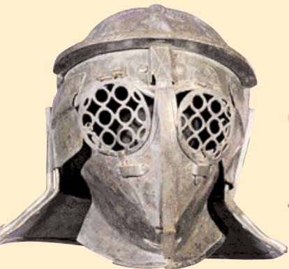
Přilba provocator s ochranou šije a malými průhledy, kolem roku 50 n. l. Hmotnost 4,35 kg.