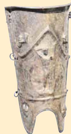
Krátký chránič nohy, určen pro murmilla, kolem roku 50 n. l. Hmotnost 0,9 kg.

Způsob boje S výjimkou bojovníků na koních a několika dalších typů gladiátorů mívali všichni zápasníci nechráněnou horní část těla. To, že některé části těla byly chráněné a jiné nikoli, mělo usměřňovat vedení zbraní