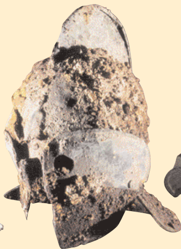
Přilba secutor. Je ze železa, pobitá bronzem, kolem roku 70 n. l. Původně vážila více než 5 kg.