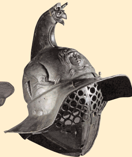
Přilba thraex s krepou a širokým hledím, kolem roku 70 n. l. Hmotnost 4 kg.