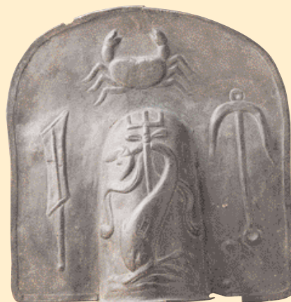
Chránič ramene retiaria, zdobí jej krab, kotva a kormidlo (1. stol. n. l.).