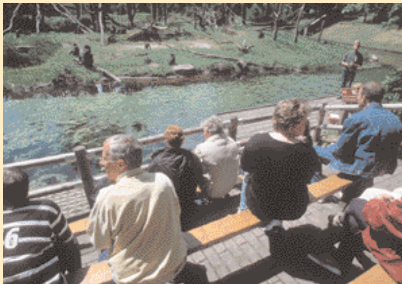
Návštěvníci zoo před výběhem opic

V nejmenším počtu jsou chováni šimpanzi bonobo – jedná se přibližně o 160 jedinců. Pouze gorily horské v lidské péči nenajdeme. Zoologické zahrady v jednotlivých světadílech jsou sdruženy do sítě chovatelských programů. Chov lidoopů