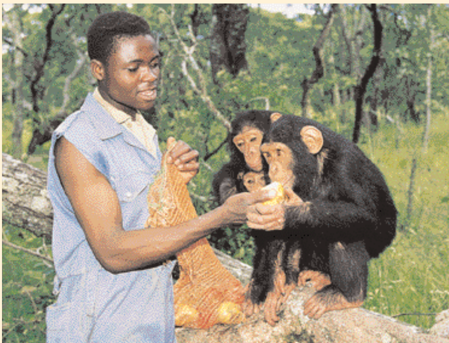
Šimpanzí sirotci se svým ošetřovatelem v Zambii

Ona se pak přikrčí a zakryje si hlavu rukama. Tak se učí pokornému chování, které pro ni bude později v gorilí skupině životně důležité. Zabrání tak fyzickému útoku. I lidé musejí při styku s divokými gorilami v Africe na toto chování přistoupit, chtějí-li, aby je gorily přijaly.