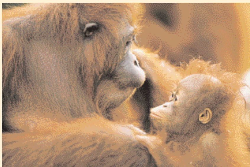
V rodině lidoopů pomáhají při péči o mládě rodinní příslušníci.

mladým samicím často pomáhají při výchově prvního mláděte babičky a tety. Starším sourozencům je dovoleno pod bystrým dohledem matky na novorozencích trénovat péči o dítě a po zacvičení se o ně starají jako chůvy. Tak se připravují na svou pozdější rodičovskou roli.