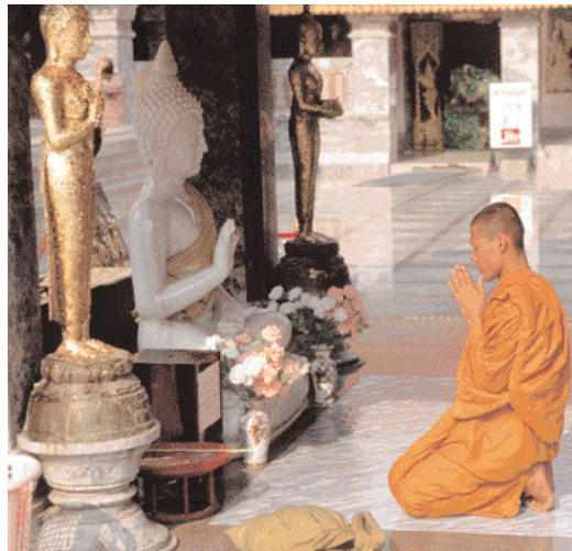
Buddhistický mnich v Thajsku se modlí v chrámu.

Thajsko, Myanmar (Barma), Laos, Komobodža, Vietnam, Malajsie, Čína, Korea, Mongolsko, Nepál, Bhútán, Tibet či Japonsko. Přestože je Indie rodištěm Buddhya, je zde buddhistické náboženství vzhledem k počtu obyvatel poměrně málo rozšířeno. V posledních 150 letech se buddhismus rozšířil i do Evropy a Severní Ameriky, kde získává stále větší popularitu a počet jeho stoupců se neustále zvyšuje.