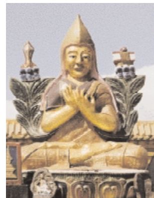
Socha Buddha z Mongolska. Má na sobě typickou mongolskou pokrývku hlavy.