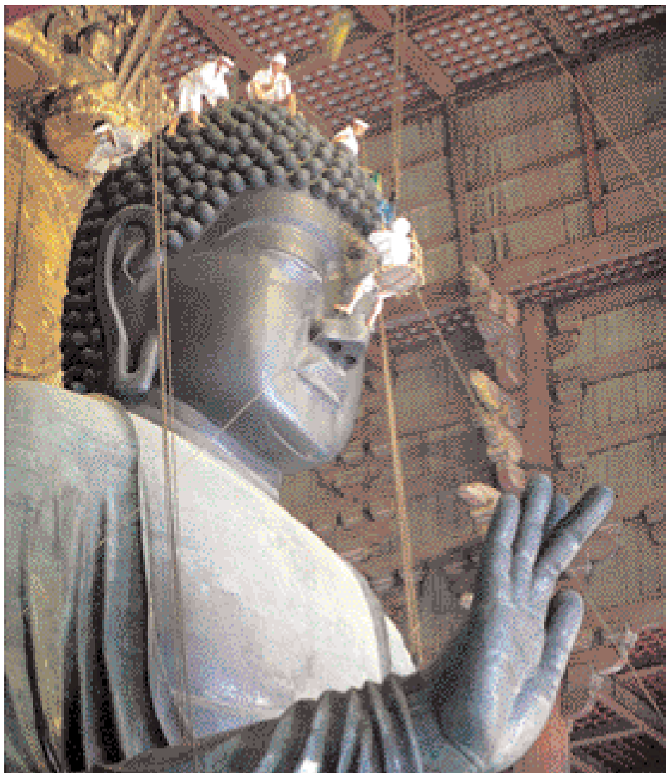
Jednou ročně se koná v chrámu Tódadží v Japonsku, největší dřevěné stavbě na světě, obřad „svatě očisty těla“. Mniši odstraňují prach z přibližně patnáct metrů vysoké sochy Buddha. Říká se, že ti, kdo přijdou do styku s tímto prachem, budou jeden rok ušetřeni neštěstí.