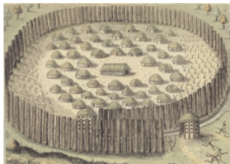
Indiánská vesnice na Floridě v 16. století