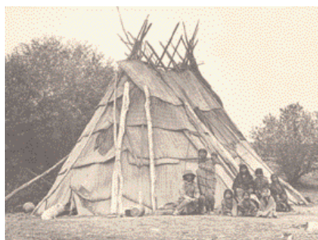
Tradiční příbytek Umatillů z tkaných rohoží