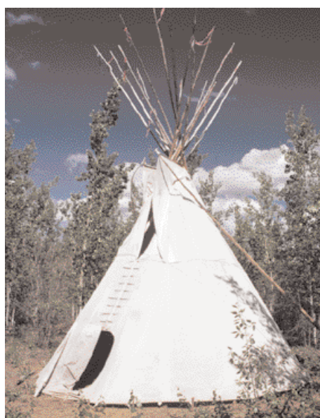
Týpí ze severozápadu Velkých planin