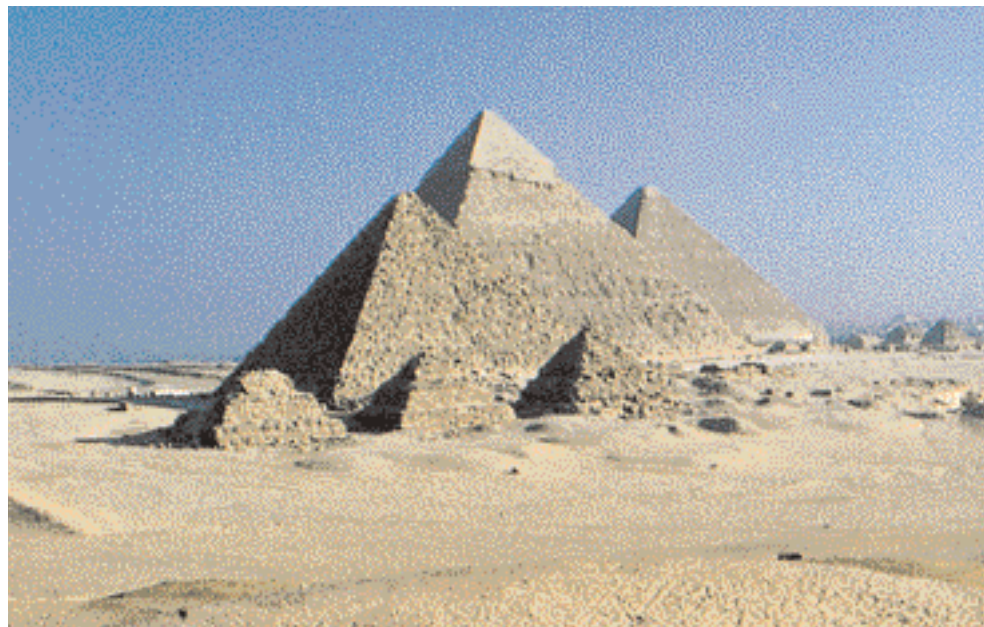
Charakteristický znak Egypta – tři velké pyramidy v Gíze. V popředí jsou vidět rovněž tři podstatně menší pyramidy, které patří k pyramidovému okrsku faraona Menkaurea.

Nejmenší (66 m vysokou) ze tří pyramid v Gíze nechal postavit král Menkaure (řecky Mykerinos), prostřední (144 m) král Rachef (Chefrén) a Chufu (Cheops) tu největší (147 m). Zdá se, že prostřední je větší, ale není tomu tak. Pouze stojí na výše položeném terénu. Jednotlivé vrstvy kamenných kvádrů lze dobře rozeznat, takže větší stěny pyramid dnes působí jako obrovské příkré schodiště. Jen na vrcholu Rachefovy pyramidy se zachoval zbytek původního obložení z jemného vápence. Dokud jím byly pyramidy obloženy, svítily jejich bílé stěny do dálí a na pozlacených špičkách se zrcadlilo egyptské slunce.