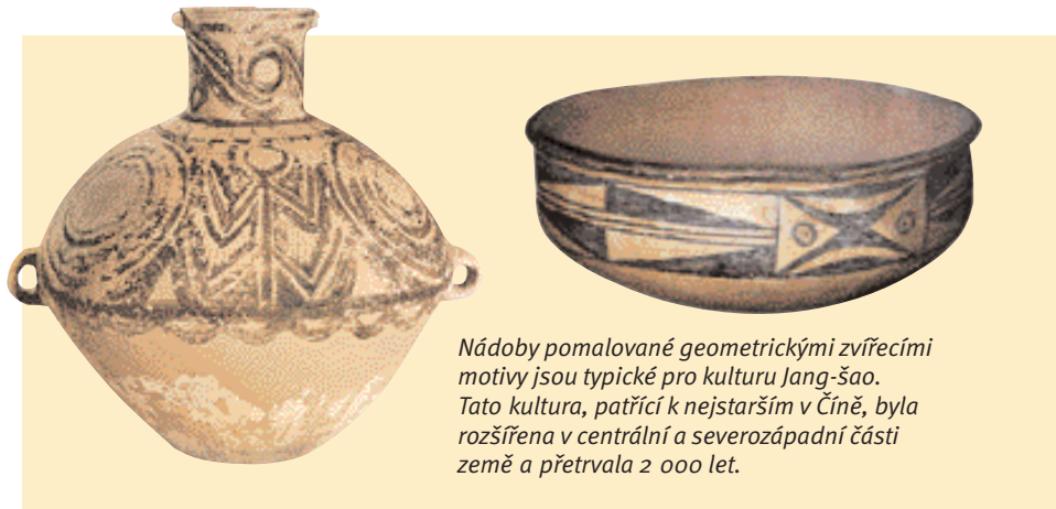
Nádoby pomalované geometrickými zvířecími motivy jsou typické pro kulturu Jang-šao. Tato kultura, patří k nejstarším v Číně, byla rozšířena v centrální a severozápadní části země a přetrvala 2 000 let.