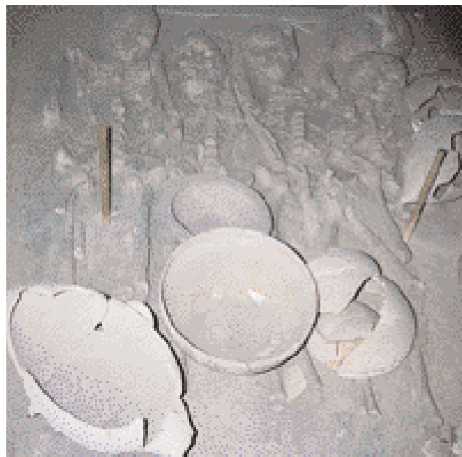
Kostrы a keramika z Pan-pcho, jednoho z nejstarších sídlišť v Číně (mladší doba kamenná, asi 4800–3600 př. n. l.)

Lze tedy údolí Žluté řeky považovat za kolébku čínské civilizace?